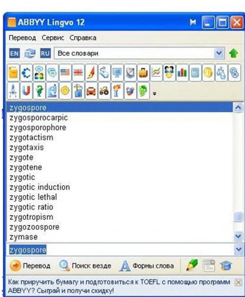
Рисунок 1. Словарная статья электронного словаря АBBYY Lingvo 12

В словарной статье электронного словаря АBBYY Lingvo 12 (рис.1) содержатся тематические подсловари, которые обеспечивают эффективный перевод определенной лексической единицы (рис.2).